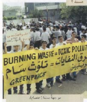
مواجهة سامة (عصاف).