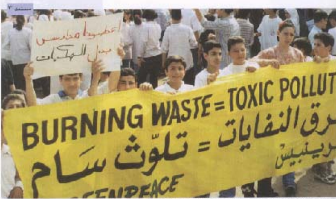
مسيرة لاهوت الجوع الذي يطالب بحماية حق من حقوق المواطنين (الحق بيعة ملجأ).